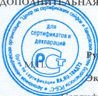
Схема сертификации - 1