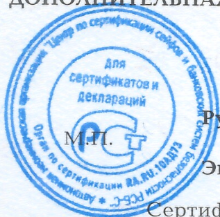
Схема сертификации - 1с