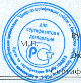
Схема сертификации - 1с