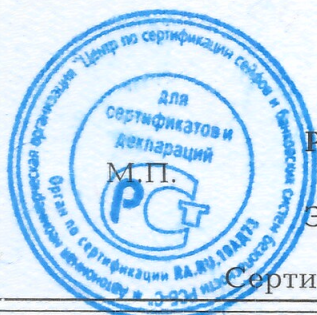
Схема сертификации - 1с